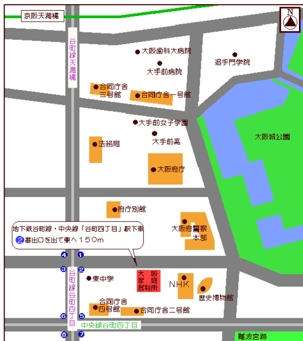
[大阪家庭裁判所周辺図]