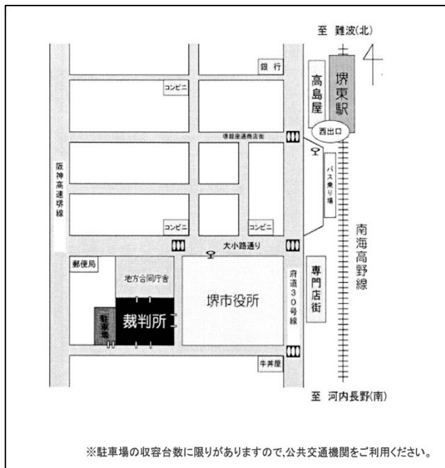
[大阪家庭裁判所 堺支部周辺図]